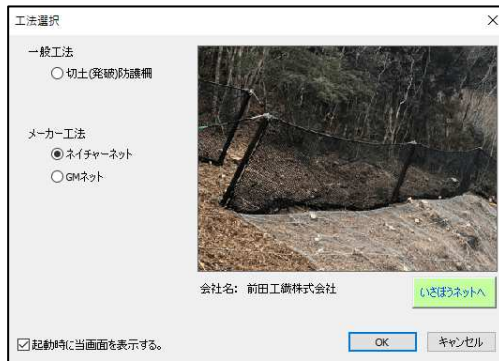
ネイチャーネット